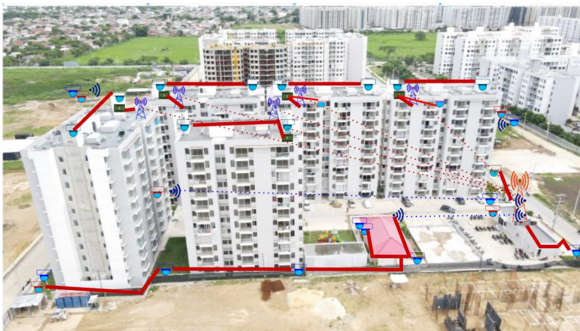
Diagrama de instalación de Cámaras